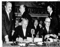
Adenauer unterzeichnet den Beitritt zur Montanunion 18.04.1951