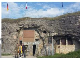
Grenzüberschreitendes Projekt des SSA OG 2017/18