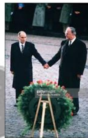
Historischer Händedruck: Mitterrand und Kohl 1984