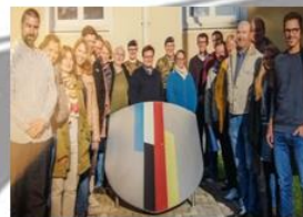
Schüleraustausch und grenzüberschreitende Projekte