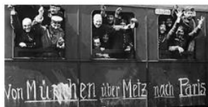
Erster Weltkrieg 1914 - 1918